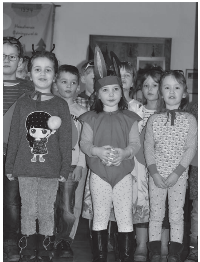
Stups der kleine Osterhase