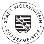
Wolfram Liebing Bürgermeister